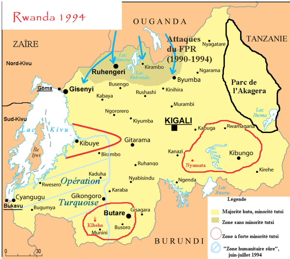
Carte 1 : Le Rwanda au moment du génocide : populations et interventions armées